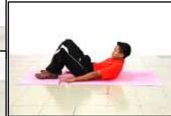
Gambar D Ringkuk Tubi Separa