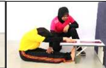
Gambar E Jangkauan Melunjur