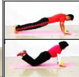
Gambar C Tekan Tubi atau Tekan Tubi Ubah Suai