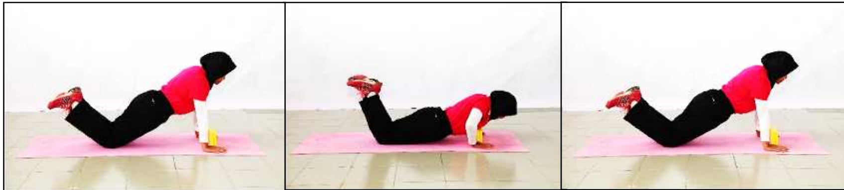
Gambar A - Sokong Hadapan atau Bersedia